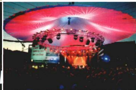
DIE GRUNDSTEINLEGUNG der Deutschen Med, von Stararchitekt Helmut Jahn aus Chicago entworfen, wurde als Pop-Event mit tausenden von Rostockern gefeiert - im Jahr 2004 soll die Einweihung des architektonisch spektakulären Highlights nahe des Kröpeliner Turms stattfinden.

Arbeiter- und Bauernstaat oder verbrecherische Partei wird man von ihm nicht hören. Es wäre auch lächerlich, wenn der bislang so erfolgreiche Geschäftsmann den hinter der verrammelten Fluchttür entmündigten Ossi geben würde.